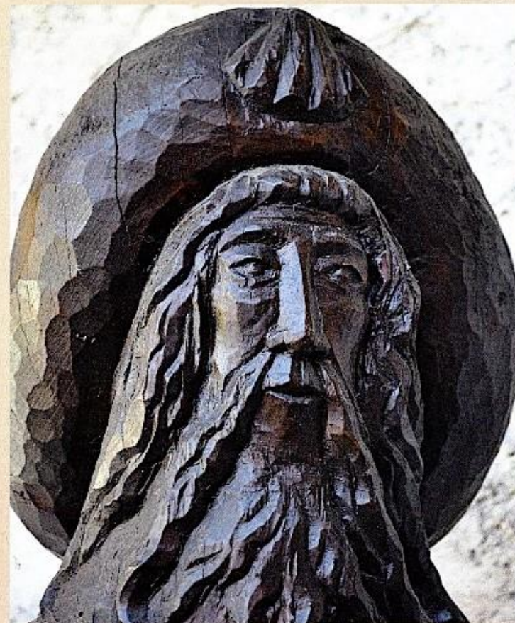
Saint Jacques de Compostelle